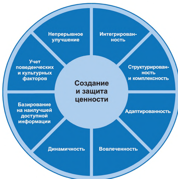
Рисунок 2 — Принципы

Принципы, представленные на рисунке 2, устанавливают характеристики эффективного и результативного менеджмента риска, отражают его ценности и объясняют его назначение и цель. Эти принципы являются основой менеджмента риска и должны учитываться при создании структуры и процесса менеджмента риска организации. Соблюдение принципов позволит организации управлять влиянием неопределенности в отношении достижения целей организации.