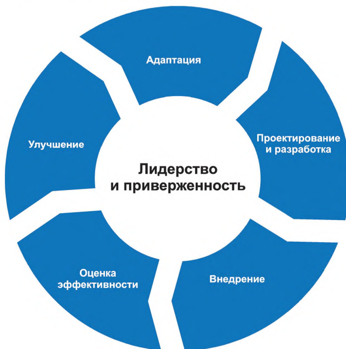
Рисунок 3 — Структура

Внедрение структуры менеджмента риска включает в себя интеграцию, проектирование и разработку, внедрение, оценку и улучшение менеджмента риска в организации. На рисунке 3 представлены компоненты структуры.