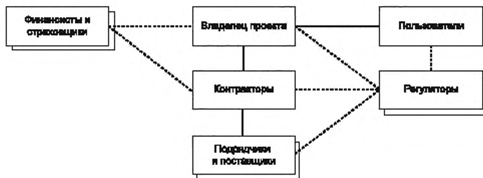
Рисунок 1 — Заинтересованные стороны проекта